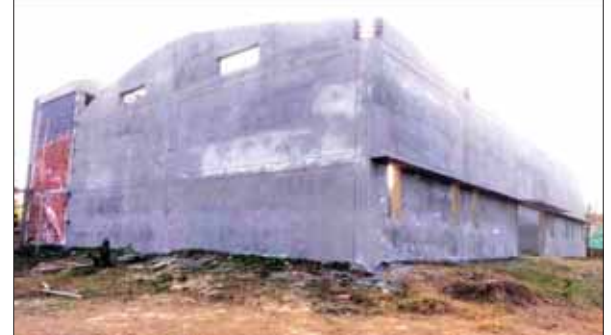
नगरपालिका खेल स्टेडियम के निकट निर्माणाधीन बैडमिंटन हाल।

गन्ौर। पांच साल लंबे इंतजार के बाद नगरपालिका खेल स्टेडियम के निकट बैडमिंटन हाल के निर्माण की उम्मीद अब फिर से जगी है। नगरपालिका ने बैडमिंटन हाल के अड्डे निर्माण को पूरा करवाने के लिए फिर से टेंडर लगा दिया है। इससे पहले जिस एजेंसी को टेंडर दिया गया था, वह निर्धारित समय बीत जाने के बाद भी स्टेडियम का निर्माण कार्य पूरा नहीं कर पाई। जिस वजह से एजेंसी का टेंडर कैंसल कर उसे ब्लैकलिस्ट कर दिया था। अब