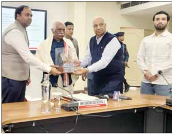
हरियाणा के महामहिम राज्यपाल श्री बंडारू दत्तात्रेय ने शुक्रवार को मैडिकल कालेज मुलाना का अवलोकन के दौरान।

कि खेल और शिक्षा दोनों में युवाओं को आगे अग्रसर रहना चाहिए। नशे को रोकने को लेकर हम सब को झिंझक प्रयास करने होंगे तभी नशे को जड़ से खत्म किया जा सकता है। प्रदेश सरकार सरकार द्वारा हर गांव में व्यायामशालाएं बनाई गई हैं ताकि युवा ग्रामीण आंचल से ही खेल जगत के तहत मजबूत प्रशिक्षण हासिल कर सकें।