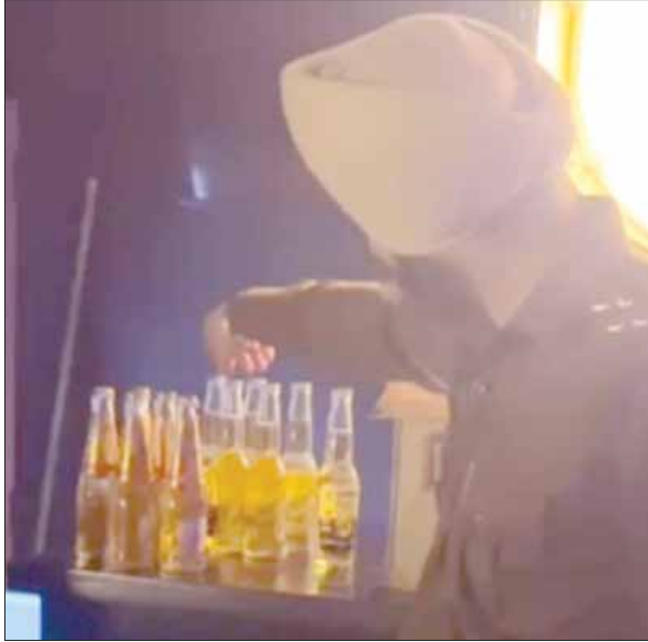
क्लब में छानबीन करती पुलिस।