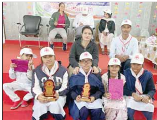
प्रतियोगिताओं में विजेता छात्राएं टीवर के साथ।