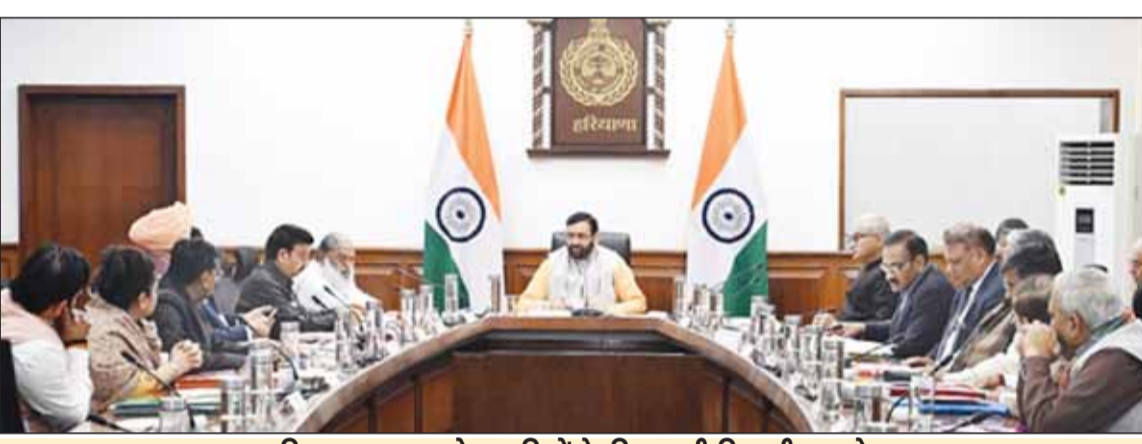
हरियाणा सरकार ने आड़तियों के लिए जारी किए तीन करोड़

हरियाणा सरकार ने प्रदेश के आड़तियों को बड़ी राहत प्रदान की है। सरकार ने रबी खरीद में हुए नुकसान की भरपाई के लिए तीन करोड़ दस लाख रुपये जारी कर दिए हैं। मंगलवार को मुख्यमंत्री नायब सैनी की अध्यक्षता में हुई मंत्रिमंडल की बैठक में यह फैसला लिया गया। बैठक के बाद मुख्यमंत्री ने पत्रकारों से बातचीत में बताया कि रबी फसल खरीद के दौरान आड़तियों को नमी वाले उत्पादों की खरीद करनी पड़ी थी। जिसके चलते उन्हें आड़तियों को वित्तीय नुकसान झेलना पड़ा था। इस संबंध में कई आड़तियों के शिष्टमंडल भी मुख्यमंत्री से मिल चुके थे। मुख्यमंत्री ने बताया कि आड़तियों की मांग पर केवल वन टाइम सहायता के लिए सरकार ने तीन करोड़ दस लाख रुपये की सहायता राशि को स्वीकृति प्रदान की है। सीएम ने साफ किया कि यह योजना केवल इस वर्ष के लिए ही मान्य होगी। इसके लिए राज्य सरकार कुल 3,09,95,541 रुपये की राशि वहन करेगी। कुल राशि में से 77,22,010 रुपये खाद्य, नामरिक आपूर्ति एवं उपभोक्ता मामले विभाग द्वारा वहन किए जाएंगे, जबकि 1,71,16,926 रुपये की राशि हरियाणा राज्य सहकारी आपूर्ति एवं विपणन संघ लिमिटेड (हेफेड) द्वारा वहन की जाएगी तथा 61,56,605 रुपये हरियाणा राज्य भंडारण निगम (एचएसडब्ल्यूसी) द्वारा वहन किए जाएंगे।