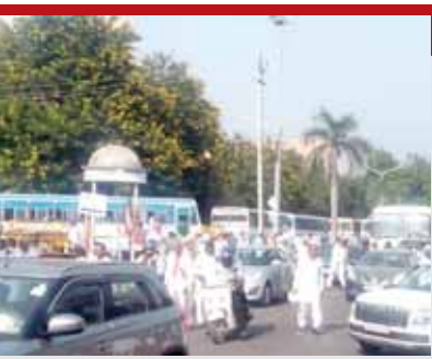
पहले से ही दिशा-निर्देश जारी कर दिए थे।

सुबह और दोपहर के समय माजरी चौक और कालका-जीरकपुर रोड जाम रहा, जबकि हाउसिंग बोर्ड रोड पर वीआईपी मूवमेंट शुरू होने के कारण वाहन सड़कों पर फंसे रहे। यात्रियों को सेक्टर-5 के आसपास के इलाकों से बचने और रास्ता बदलने के लिए दिशा-निर्देश जारी करने के बावजूद, पंचकुला पुलिस शहर में सुचारु आवागमन सुनिश्चित करने में विफल रही। कार्यक्रम में भारी भीड़ उमड़ने की उम्मीद के चलते राज्य सरकार ने उपस्थित लोगों को शहर तक पहुंचाने के लिए राज्य भर से 2000 से अधिक बसें मंगवाई थीं। इज्जर, कुरुक्षेत्र, गुरुग्राम, सोनीपत, कैथल और अन्य क्षेत्रों से बसें आईं। सेक्टर-1 में रेड बिशप ट्रिस्ट कॉम्प्लेक्स के पास वाहनों की पार्किंग के कारण सुबह के समय थोड़ी भीड़भाड़ हुई, लेकिन एमडीसी क्षेत्र के पास पहरा दे रहे पुलिस अधिकारियों ने वाहनों को सड़कों से हटाने के लिए यातायात को पुनर्निर्देशित किया।